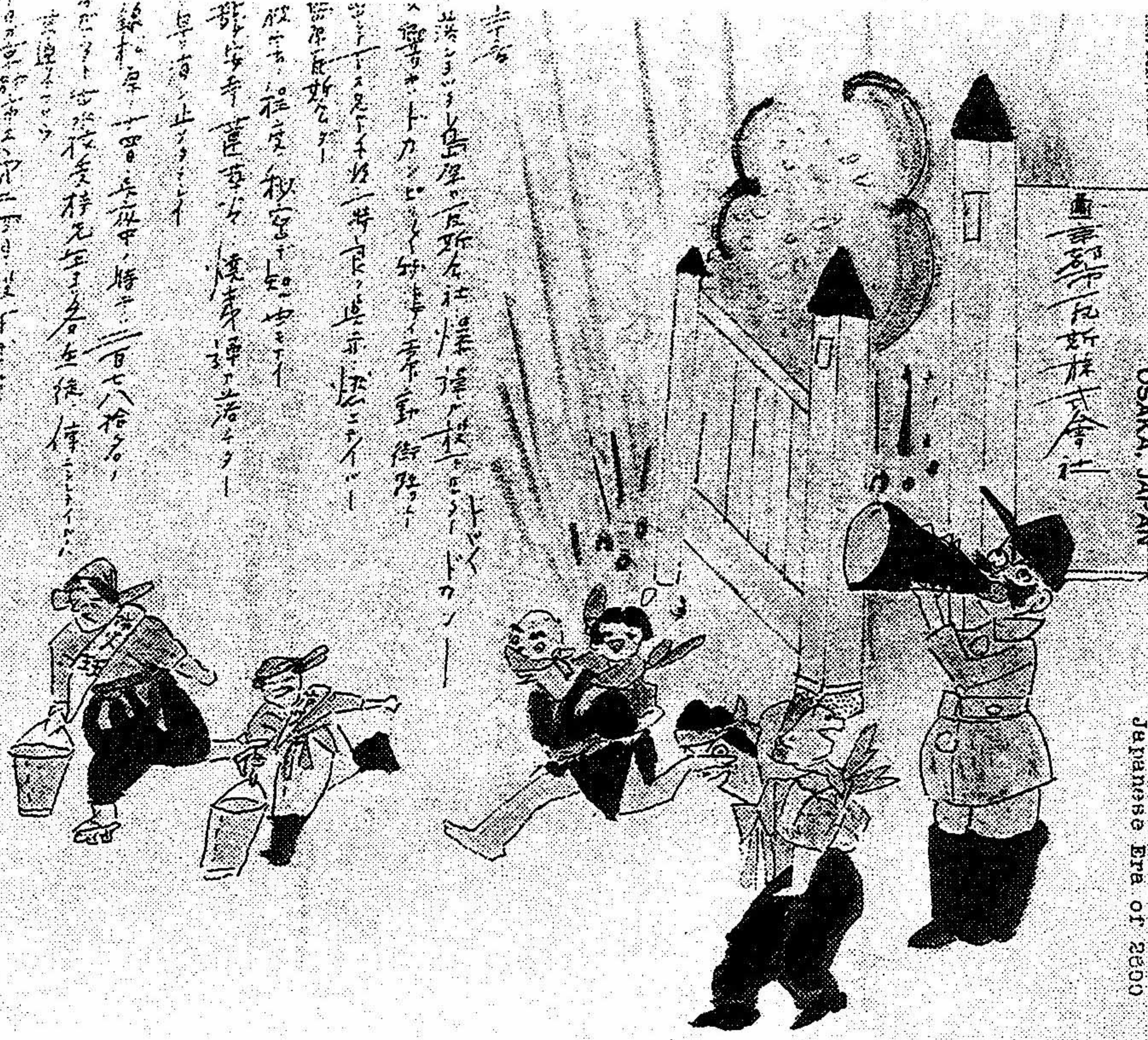
空襲の様をしるした日記

HIRAKAWA JIMMY P. O. BOX NO. 4 SEMBA OSAKA, JAPAN Japanese Era of 2500 No. 25 OSAKA JAPAN